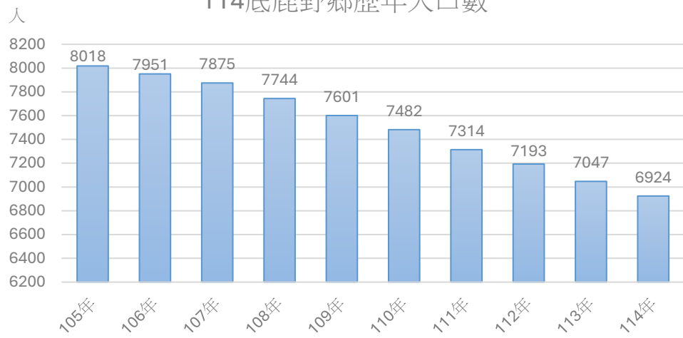
114底鹿野鄉歷年人口數